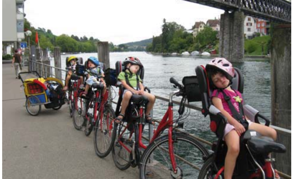
Una vacanza decisamente rilassante

Al primo cavalcavia sperimentiamo una rampa di accesso per le bici che, con una dolce salita a spirale, ti consente di affrontare il ponte senza fatica. Incredibile!