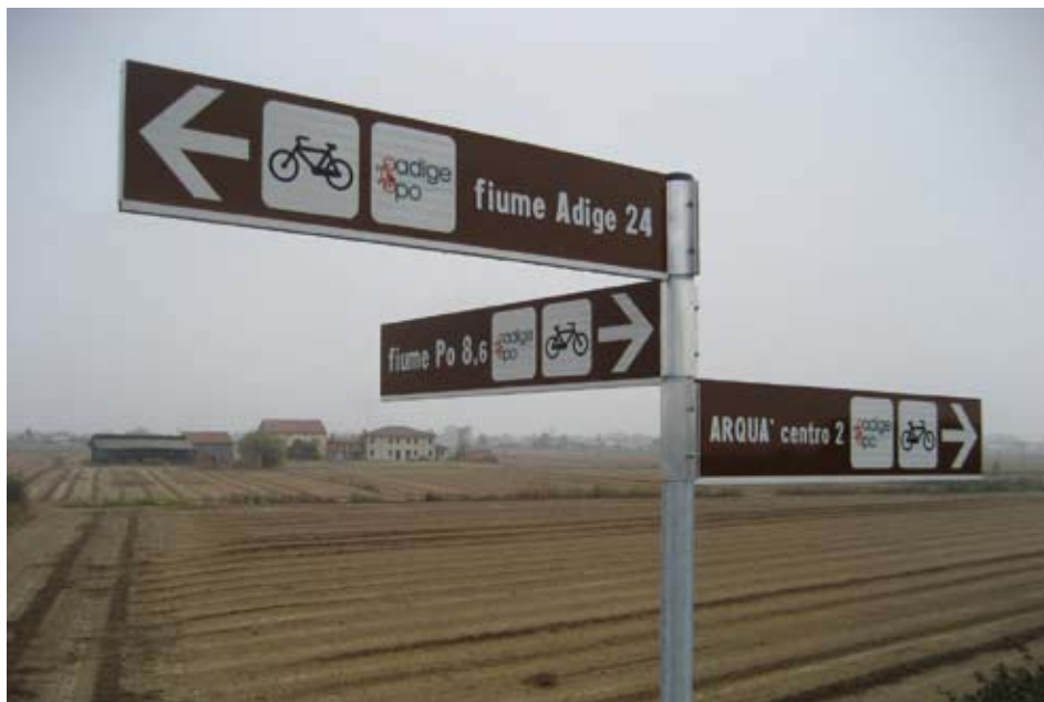
Un ottimo esempio di segnaletica

I percorsi indicati si snodano su piste ciclabili esistenti e sulla rete di strade a basso traffico