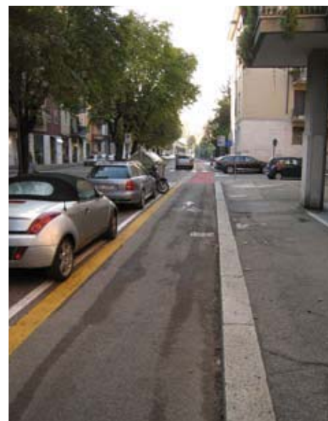
La pista soppressa di Via Todeschini

Per quello che si vede ora, sia pure con qualche spigolosità di troppo, sembra costituire un bel passo avanti: un collegamento importante che certamente avvantaggerà i penalizzatissimi ciclisti che abitano a Borgo Roma. Una volta realizzata la segnaletica orizzontale capiremo se i ciclisti verranno o no mollati a loro stessi agli incroci e se la pista sarà effettivamente un vantaggio. Speriamo bene.