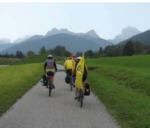
La cavalcata dei "Monti pallidi"

A cinque anni dall'avvio dell'iter burocratico, che ha visto impegnate varie regioni e province italiane e molti tecnici ed esperti, quest'anno le Dolomiti sono state riconosciute dall'Unesco Patrimonio dell'Umanità, una nomina che dovrebbe garantire loro per il futuro maggior tutela ecologica e paesaggistica.