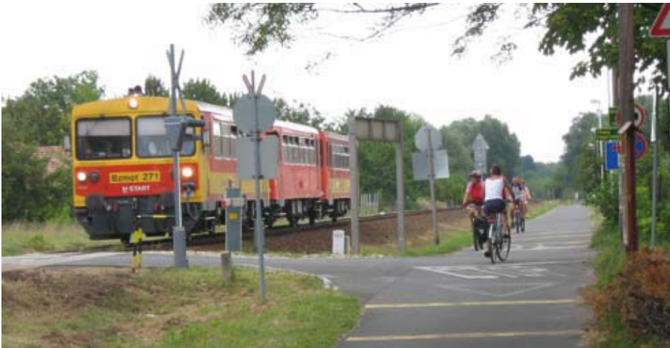
La ciclabile del Balaton

ne legato ad un piccolo rimorchiatore e in pochi minuti ci porta sull'altra sponda a Lorev. Siamo in una isola racchiusa fra due rami del Danubio. Raggiungiamo Rackeve e ci concediamo una pennichella. C'è verde, un bel ponte e l'aspetto è quasi di una città inglese. Troviamo la segnaletica EuroVelo 6 che seguiamo fino a Sziofot. Alloggi zero.