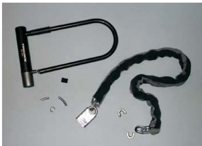
I super lucchetti ...tranciati

La piaga dei furti di biciclette ha colpito, prima o poi, tutti noi. Le stiamo tentando tutte. I super lucchetti tranciati, nei quali riponevamo molta fiducia, ci riempiono di angoscia. Soprattutto ci riempie di angoscia l'indifferenza che circonda questo fenomeno, che andrebbe trattato ormai come un problema sociale.