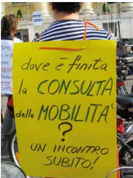
Uno dei cartelli di S.I.N.D.A.C.O.

Il programma completo (DA OTTOBRE A MARZO) è scaricabile dal sito www.teatroimpiria.net .