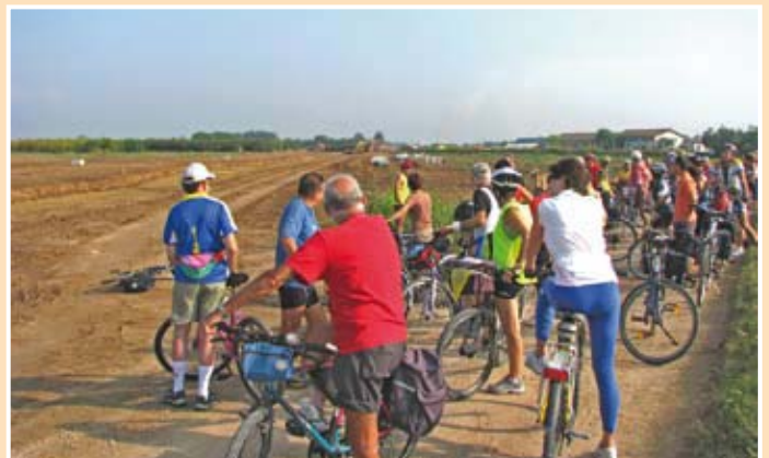
La prima delle due interruzioni

rotta, ma possa mantenere la sua integrità con la costruzione di due semplici e poco costosi sottopassi, utili anche agli agricoltori che si sono visti tagliare in due i loro fondi. Ci sono altre soluzioni? Vorremmo parlarne con chi di dovere. E nei prossimi mesi torneremo alla carica.