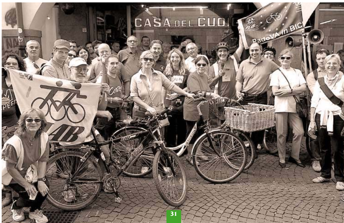
Foto di gruppo davanti ad una bottega storica

Alla fine, foto di gruppo con biciclette e tutti in Fiera!