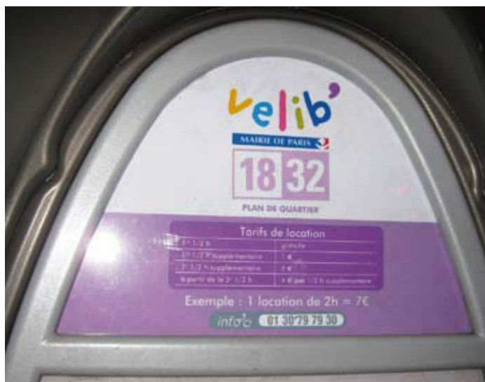
La cassa automatica di un vélib

I parigini vanno sempre di corsa, i turisti lentamente e guardandosi intorno. Attenzione, però, se per caso arrivate dall'Italia con la vostra costosa bicicletta al seguito, state attenti e legatela per bene oppure lasciatela in albergo e muovetevi con il velib. C'è infatti il serio rischio che la vostra amica a 2 ruote venga o danneggiata oppure rubata.