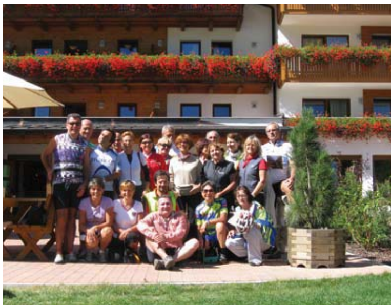
Sosta all'hotel Feuerstein in Val di Fleres

ti di roccia strapiombanti a destra. Splendido percorso! Dopo un breve giro a Bolzano, città sicuramente a misura d'uomo e di bicicletta, eccoci in stazione per il ritorno. Il Catinaccio compare sullo sfondo, ci saluta e sembra dire: ritornate presto in uno dei luoghi più belli del mondo!