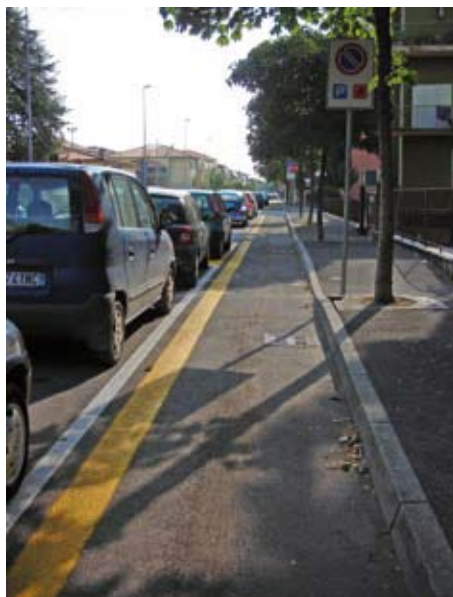
Pista di Via Monte Bianco

Vi ricordate perchè è stata dichiarata pericolosa la ciclabile di via Todeschini? Perchè correva parallelamente alle auto in sosta fra stalli e marciapiede (L'Arena 6.11.2007). Esattamente nello stesso modo è stata realizzata la nuova pista ciclabile di via Monte Bianco. Incredibile come, pur nell'epoca della globalizzazione, quello che questa amministrazione considera pericoloso in Borgo Trento diventa miracolosamente sicuro a San Michele. La pista di via Monte Bianco non è, secondo noi, insicura per via delle auto parcheggiate, ma perchè gli stalli di sosta arrivano a ridosso degli incroci (si riduce la visibilità dei ciclisti) e perchè proprio sugli incroci smette di esistere mollando chi usa la bici proprio nel momento del bisogno. Possibile che ancora oggi qualcuno lavori così male?