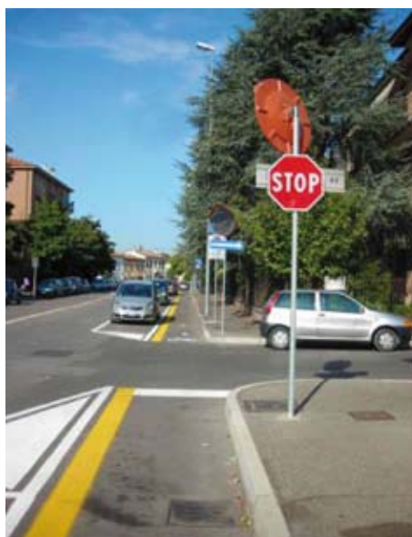
Via Monte Bianco: e l'incrocio?

Nei comunicati dell'amministrazione ripresi dall'Arena la sua la sua realizzazione è stata data per imminente almeno quattro volte l'1.5.2008 - il 3.02.09 - il 2.09.09 e il 10.10.09. Quest'ultima volta per dire che, colpa delle Ferrovie, verrà realizzata lungo viale Venezia (sul marciapiede lato ferrovia) solo nel tratto fra il