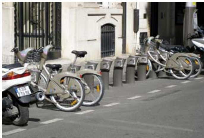
La stazione numero 2