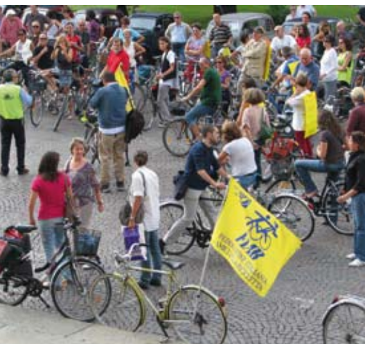
Partecipanti a S.I.N.D.A.C.O.