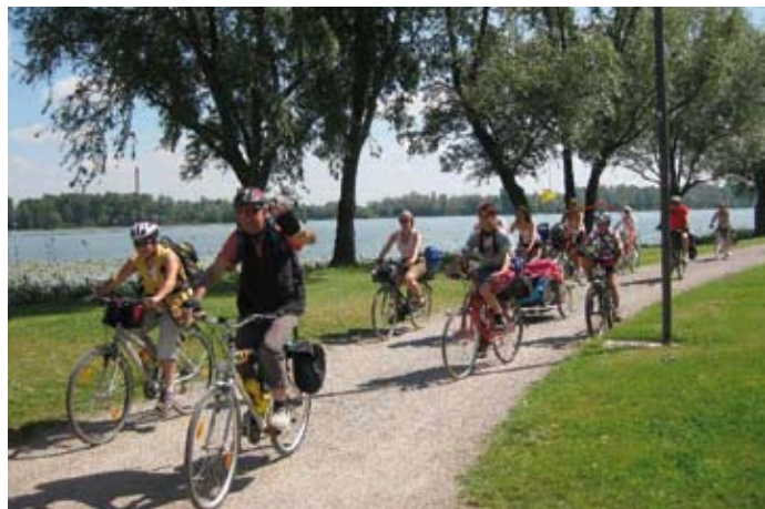
Lungo i laghi di Mantova

Ho 11 anni e mezzo e da 6 anni faccio parte degli Amici della Bici di Rovigo.