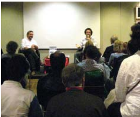
L'incontro alla FNAC

Quattro erano le iniziative messe in cantiere dalla nostra Associazione per celebrare questo importantissimo evento, voluto fortemente dall’Unio-