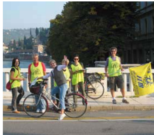
22 settembre: il varco sul Ponte Nuovo