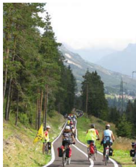
La ciclabile della Pusteria

Consiglio finale: andate sul sito www.piste-ciclabili.com/itinerari/65-ciclabile-delle-dolomiti ...e fatevi venire l'acquolina in bocca!