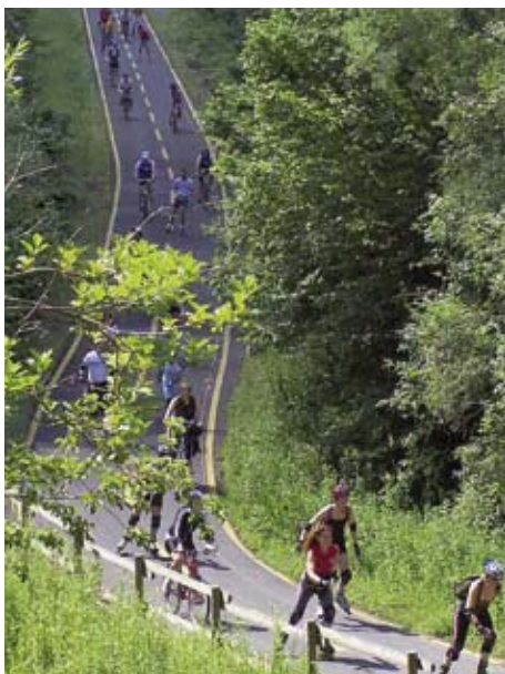
Lungo uno dei percorsi Alpe-Adria

I pattini quindi sono intesi principalmente come mezzo di svago e sono davvero pochissimi ad usarli come mezzo di tra-