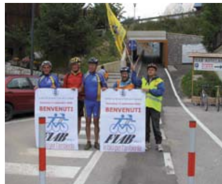
Inaugurazione del sottopasso ciclabile

Sabato 12 e domenica 13 settembre anche noi Adb di Verona abbiamo partecipato al DOLOMITI DAY 2009. Titolo? "Dalle sorgenti del torrente Aurino a San Vito di Cadore lungo la ciclovia della val Pusteria". Obiettivo? Sollecitare i Comuni attraversati dal percorso a completare la ciclovia. Ingredienti? 80 cicloturisti Fiab da Mestre, Treviso, Belluno, Vicenza e Verona, boschi, prati, torrenti,