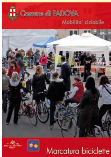
Immagini dal volantino del comune