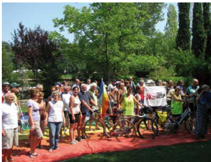
La partenza da Ca' Forneletti

Hanno incontrato e sensibilizzato la popolazione di molte città e cittadine attraversate, sono stati accolti e sostenuti da