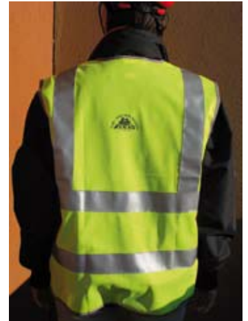
I particolari del giubbotto