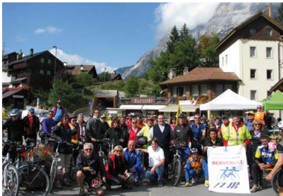
Foto con sindaco a San Vito di Cadore

laghi, cime incantevoli, accogliente casa per vacanze a Tesido di Pusteria, simpatico sindaco di San Vito di Cadore. Svolgimento? Due giornate fantastiche trascorse a godere le bellezze della natura, a rinnovare il piacere dello stare insieme, ad impegnarsi per la promozione di un importante progetto cicloturistico, ad apprezzare l'accoglienza del Comune di San Vito e del suo Sindaco, che ci hanno dato il benvenuto con un simpatico rinfresco, ma soprattutto ci hanno fatto inaugurare un importante sottopasso ciclistico che immette nella piazza principale del paese. Averne di amministrazioni così attente alla ciclabilità del loro territorio!