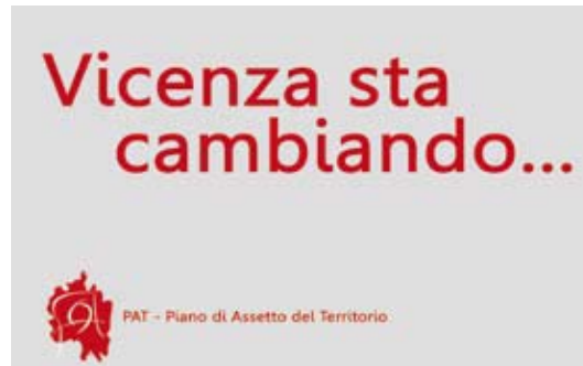
La copertina del piano

Autove- lox acustici: Il documento sulla zonizzazione acustica della città è bello ed interessante, ma ha poco valore