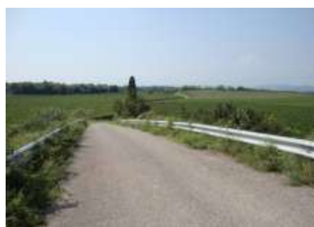
Ciclabile della Bardolina