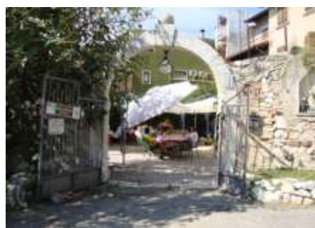
L'Agriturismo Delibori di Incaffi