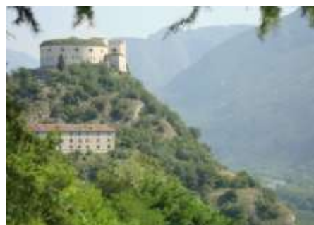
Forte Wohlgemuth a Rivoli