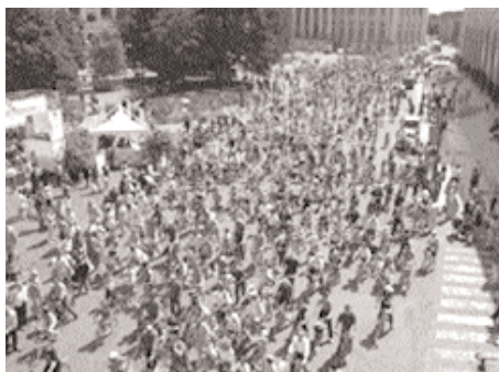
La foto aerea scattata in piazza Bra testimonia il grande successo della manifestazione veronese.

Almeno 2500 ciclisti - bambini e genitori - hanno sfilato nel corteo principale di Bimbibici 2005. Tre cortei provenienti da altrettanti quartieri periferici della città hanno raggiunto l'Arsenale da dove è partito il serpentone che ha percorso un itinerario di sette chilometri tutto interno al centro storico di Verona. Rientrati all'Arsenale, ai bambini è stato offerto un rinfresco a base di frutta, merendine e succhi biologici. La manifestazione, che ha avuto il patrocinio del Comune e l'appoggio di altre associazioni ambientaliste, di volontariato e gruppi di famiglie dei quartieri, è stata preceduta da una serie di iniziative a tema nelle scuole come "Pedibus" e "Vado a scuola da solo". Anche quest'anno Bimbibici si è tenuta pure in due comuni della provincia: San Bonifacio e San Giovanni Lupatoto.